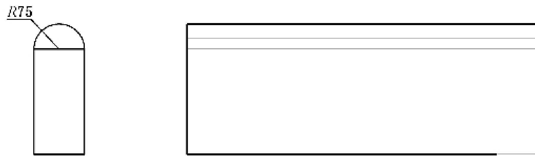
图 1 异形板示意图